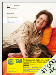
Magazin der Schweizerischen Vereinigung für hirnerkrankte Menschen