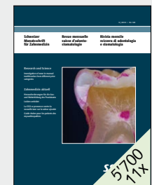
Für die fachliche Fortbildung und Standespolitik der Schweizerischen Zahnärztesgesellschaft SSO