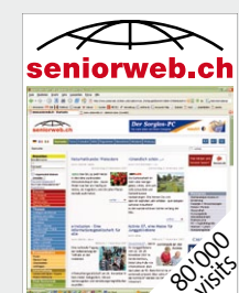
Einzig dreisprachige Website der 3. Generation