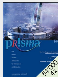
Offizielles Organ der Interessengemeinschaft für Menschen mit Diabetes