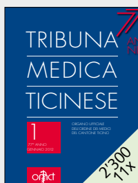
Offizielles Publikationsorgan der Tessiner Ärzteschaft OMCT (Ordine dei Medici del Canton Ticino)