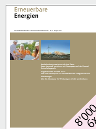
Schweizer Fachzeitschrift für Erneuerbare Energien von SSES und Swissolar