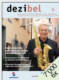
Die Zeitschrift für Hören und Erleben