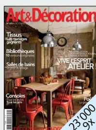
Führende Zeitschrift für den Wohnbereich in Frankreich