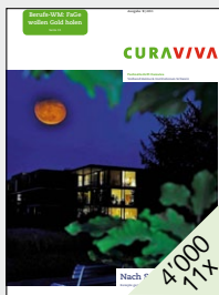
Für leitende Angestellte in Heimen und Institutionen