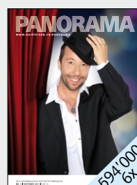
Das Kundenmagazin der Raiffeisenbanken