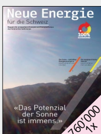
Magazin des Vereins KlartextEnergie