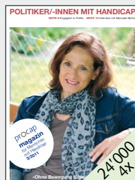
Publikationsorgan des Schweizerischen Invalidenverbandes