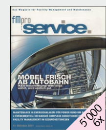
Zeitschrift von fmpro - Schweizerischer Verband für facility management und maintenance