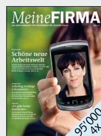
Schweizer KMU-Magazin von AXA Winterthur