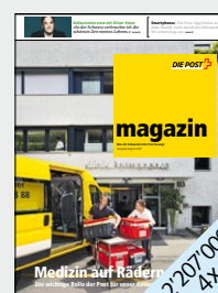
Die Unternehmenspublikation für Haushalte in der ganzen Schweiz