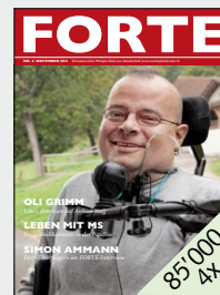
Zeitschrift für Gönner und Spender der Schweizerischen Multiple Sklerose Gesellschaft