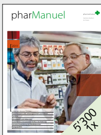
Nachschlagewerk für Apothekerinnen und Apotheker