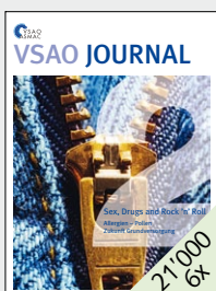
Kommunikations-Organ des VSAO, Verband Schweizerischer Assistenz- und Oberärztinnen und -ärzte