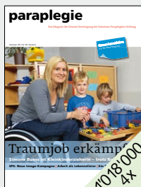
Publikationsorgan der Schweizer Paraplegiker-Stiftung