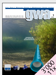
Gas, Wasser, Abwasser Publikationsorgan des SVGW und des VSA