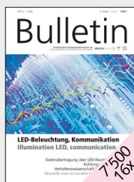
Zeitschrift für Informationstechnik und Elektronik sowie Energietechnik und Elektrizitätswirtschaft